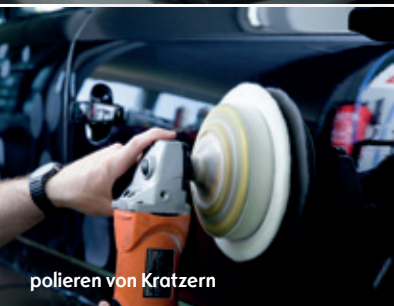
polieren von Kratzern

Wie schnell fängt man sich beim Fahrzeug kleine Kratzer , Dellen oder einen Steinschlag in der Windschutzscheibe ein? Ein Ärgernis, das man sich gerne ersparen würde. Damit nicht genug. Meistens ist die Reparatur zeitaufwändig und kostenintensiv.