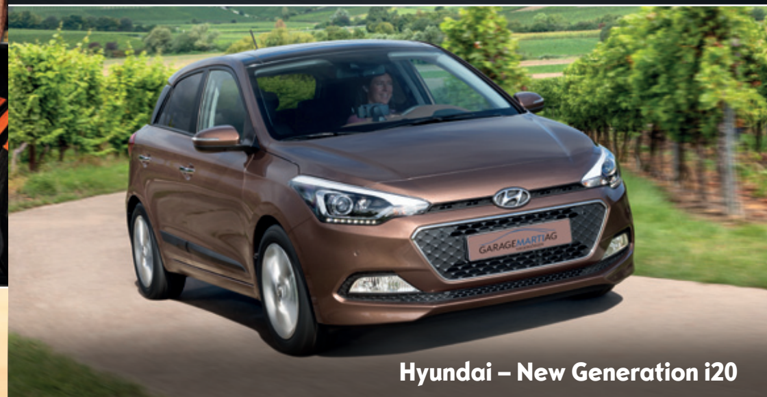
Hyundai – New Generation i20

Spüren Sie bereits den Frühling? Die richtigen Reifen sind nicht nur im Winter für sicheres und ökologisches Vorankommen entscheidend. Darum bieten wir unseren Reifenkundinnen und -kunden jeweils von 08.00 Uhr bis 13.00 Uhr wieder die speziellen Radwechseltage an.