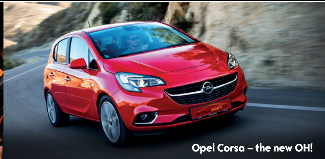
Opel Corsa – the new OH!