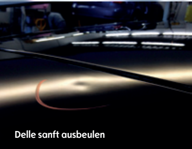
Delle sanft ausbeulen

Schönheitskur aus unserer eigenen VSCI-Carosserie